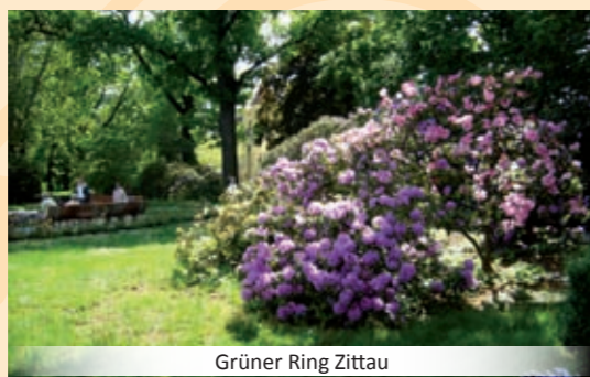
Grüner Ring Zittau