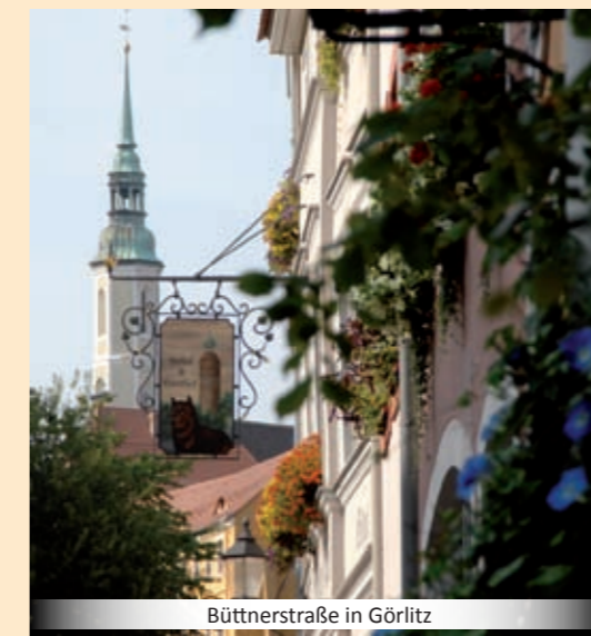
Büttnerstraße in Görlitz

Sie haben technische Probleme mit Ihrem Rad? Dann nutzen Sie die Fahrradservicepunkte entlang des Oder-Neiße-Radweges.